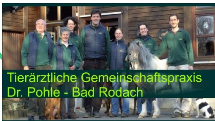
Tierärztliche Gemeinschaftspraxis Dr. Pohle - Bad Rodach