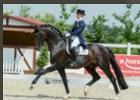
For Romance I OLD Fürst Romancier - Sir Donnerhall I