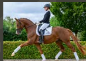
Forte per me For Romance I OLD - De Niro