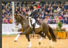
Bon Courage Bon Coeur-Vivaldi