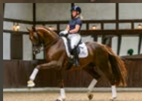
Bellany Bon Coeur - De Niro