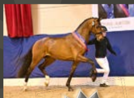
Verbier Von und zu - Dancier