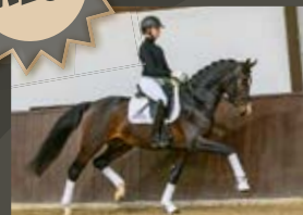
Seraphin So Unique - Don Romantic