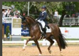
La Vie Livaldon - Scolari