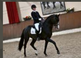
Rock For Me Rock Forever I - Florencio I

Dressurpferde Leistungszentrum Lodbergen GmbH Zum Jägereck 2, 49624 Lönningen/Lodbergen, Germany T +49-5432-5959460, F +49-5432-59594699, info@dressurleistungszentrum.de www.dressurleistungszentrum.de