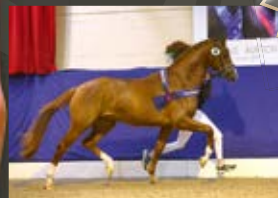
Djacomo Desperado - El Capone